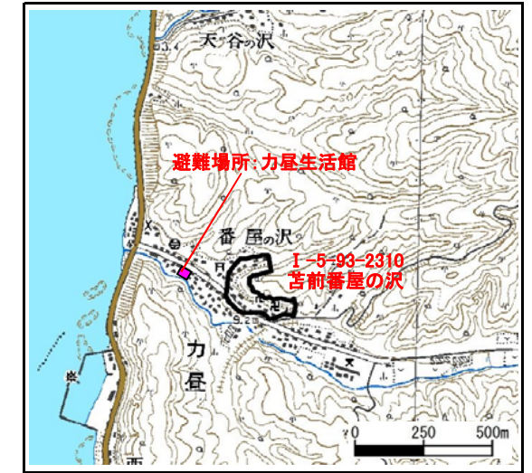
位置図 (図の上位が北を示す)