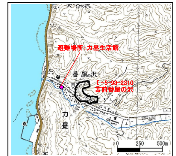
位置図 (図の上位が北を示す)

避難場所：力屋生活館 住 所：苫前町字力屋220-5 電 話：0164-66-1448