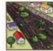
急に川の流が濁り、流木が混ざり始める。

次のような現象を察知した場合は、土砂災害が直後に起こる可能性があります。直ちに周りの人と安全な場所へ避難するとともに、関係機関へ通報して下さい。