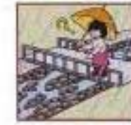
雨が降り続けているのに川の水位が下がる。