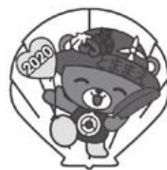
前回2020年のデザインです

審査では、採用作品賞1点及び入選5点以内を決定し、それぞれに賞状と、副賞として、採用作品賞1点にはQ U Oカード5千円分を、入選5点にはそれぞれQ U Oカード1千円分を贈呈させていただきます。