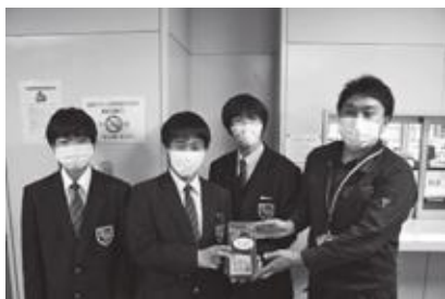
◎赤い羽根共同募金運動

なお、令和3年度の町内の助成事業の公募は既に終了し、北海道共同募金会へ申請中です。