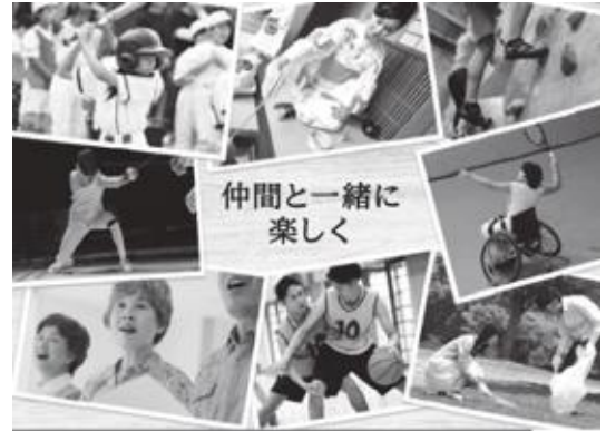
小さな掛金、大きな補償

※苫前町公民館及び苫前町役場（2階子ども教育課）で随時受付しています。（福祉センターでの受付はございません。）