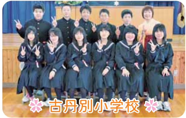
＊ 古丹別小学校 ＊