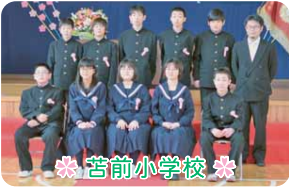
＊ 苫前小学校 ＊