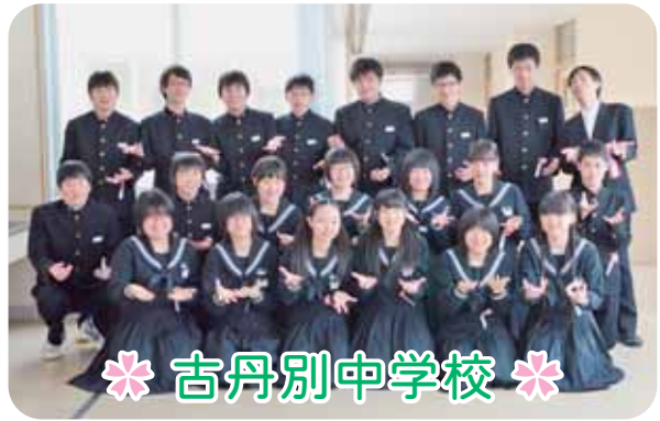
＊ 古丹別中学校 ＊