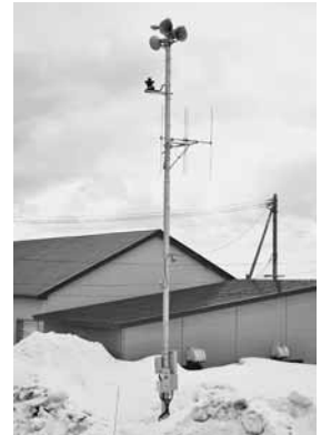
港地区に設置の屋外拡声子局