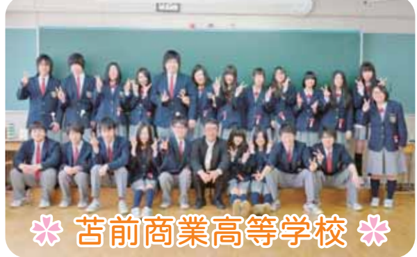
＊ 苫前商業高等学校 ＊