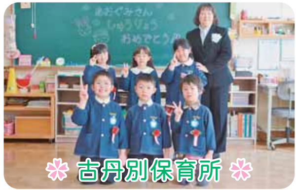
＊ 古丹別保育所 ＊