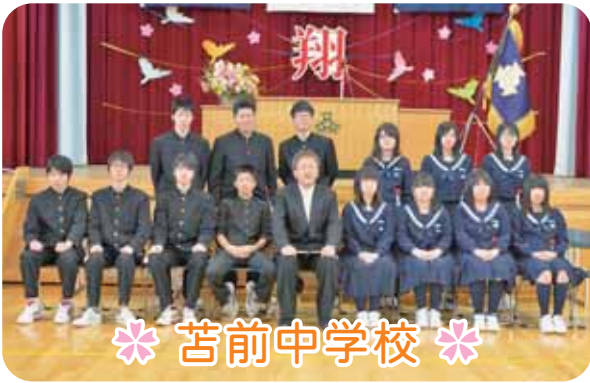
＊ 苫前中学校 ＊