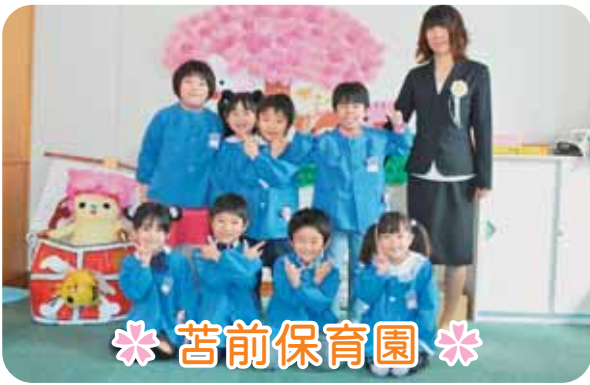
＊ 苫前保育園 ＊