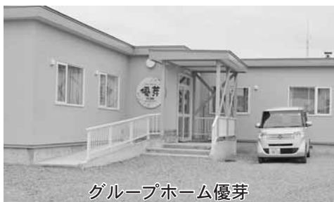
グループホーム優芽

認知症対応型共同生活介護(グループホーム)は、認知症を持つ高齢者が、9人以下の少人数で共同生活をしながら、入浴、排せつ、食事等の日常生活上のお世話や機能訓練をしてもらえる施設。