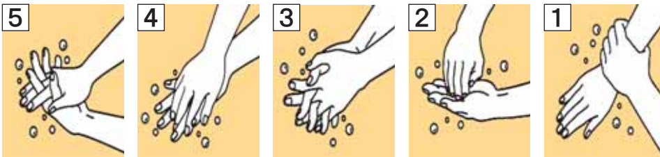
1 手のひらを洗います。 2 手の甲も包むように洗います。 3 指の間も洗います。 4 指先、爪も入念に洗います。 5 手首も忘れずに洗います。

◆手洗いのポイント 今回は手洗いの見落としがちなポイントを紹介します。帰宅後、人混みから戻った時調理前、食事前などは手を洗いまししょう。