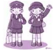
教育委員会管理課