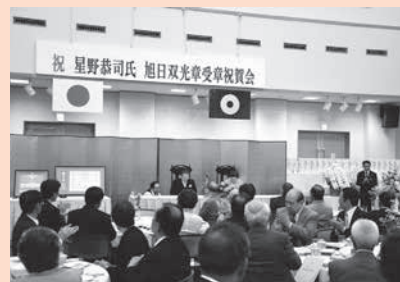
受章を祝う祝賀会の様子