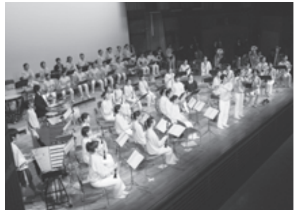
平成22年に実施された同校吹奏楽部コンサートより