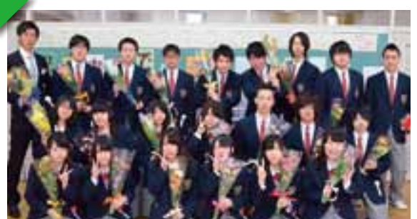
苦前商業高等学校