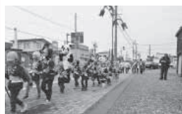
(下) 古丹別市街での車両啓発パレードの様子

21日(火)には苫前市街地で防火パレードが行われ、幼年消防クラブの苫前保育園の園児、婦人防火クラブ員、シルバー防火クラブ員などが参加し、火災予防を呼びかけた。