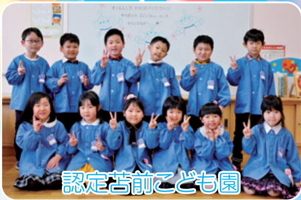
認定荻前こども園