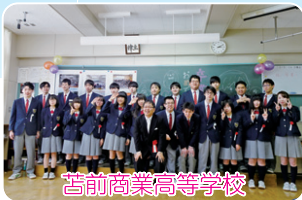
荻前商業高等学校