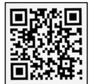
高校ホームページ

日 時 8月27日(土) 10時00分～15時00分 場 所 上田ファームさん店舗(字古丹別) その他 ・テイクアウト・パンは売り切れ次第終了となります ・詳細については、右のQRコードから高校HPやInstagramをご覧ください