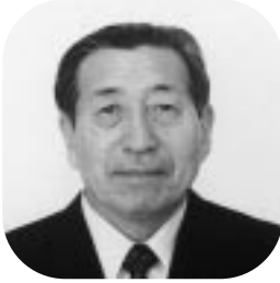
西田 清一 議員