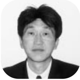
阿部 俊一 議員