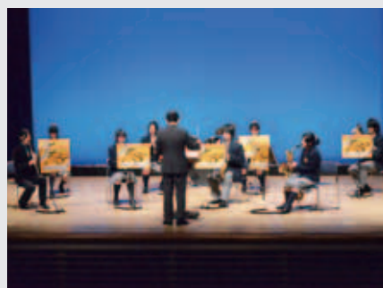
苫前商業高等学校吹奏楽部

広報とままえ12月号の町民舞台発表会ギャラリーで苫前商業高等学校吹奏楽部のところに別の出演団体の画像を掲載しました。改めて掲載させていただきます。大変申し訳ありませんでした。