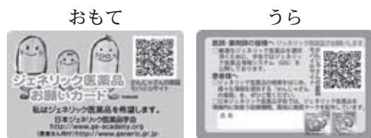
日本ジェネリック医薬品学会HP「かんじゃさんの薬箱」より引用

お問い合わせ 苦前町町民課しあわせ係・けんこう係 0164-64-2215(内線226・273)まで