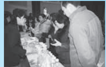
平成21年度 出会えー留(苫前町開催)の様子