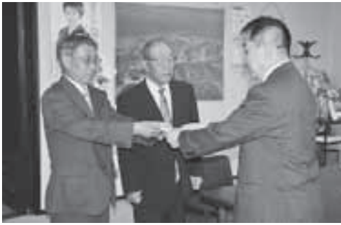
苫前町町内会連合会より