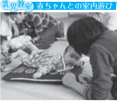
うつせ遊びでお母さんの顔が見えたよ。

子育てをめぐる考え方は時代とともに変わっています。子育ての主役は親子です。ときに親の思いを尊重し、地域・家庭で子(孫)育てをサポートしていきましょ。