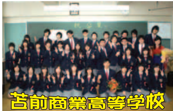
苦前商業高等学校