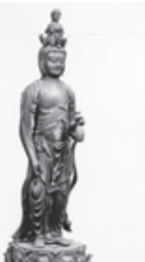
北海道指定文化財十一面観音立像