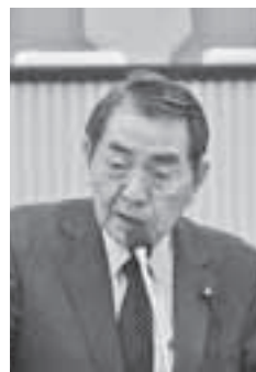
猫 島 議員