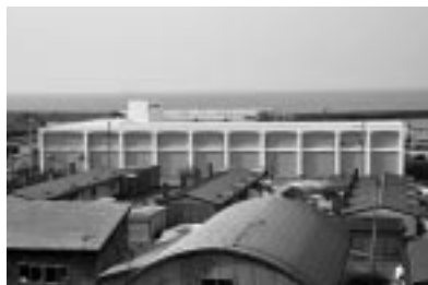
港地区にそびえ立つ 水産鮮度施設

祝賀会で今組合長は「待ち望んでいた施設が完成した。これまで以上の安定供給と鮮度の高い魚介類を生むことができる。この施設が地域発展につながるように努力して行きたい」とあいさつ。森町長は「この施設を有効活用し、安心、安全な水産物の安定供給を目指してほしい」と祝辞を述べた。松岡支庁長は「一層の漁業経営と浜の元気、活気が続き豊漁であることを期待致します」と祝辞を述べた。