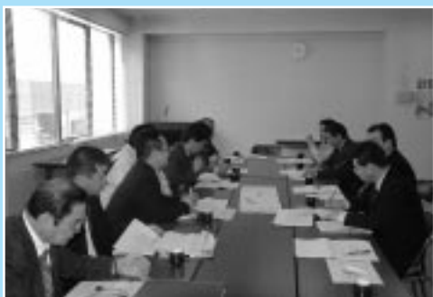
要望事項を協議する町職員と留萌土木現業所職員

また、留萌土木現業所からは、平成十七年四月施行の「公共工事の品質確保の促進に関する法律」総合評価方式の必要性とメリットについての概要説明等があった。