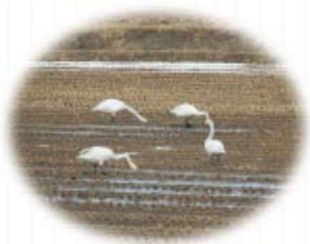
春の訪れとともに白鳥がやってきた