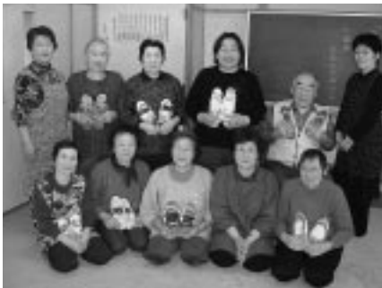
香川地区の皆さん

平成20年度以降は、開催地区を順次拡大しながら介護予防事業を展開していく予定である。