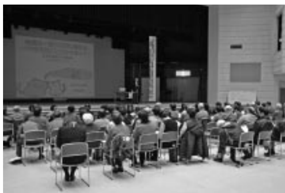
約100人が参加した講演会

午後からは、古丹別小学校で講演を行い、タバコの害や禁煙などについて学習を深めた。