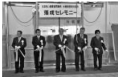
セレモニーの代表者による テープカット。