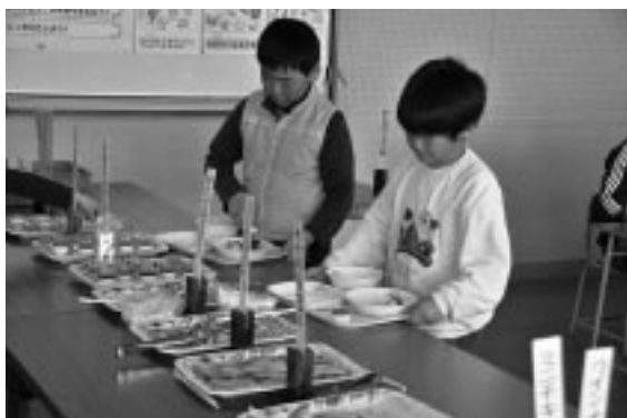
バイキングの盛りつけを楽しむ児童

児童からは「いつもバイキング給食だったらいいのになぁ」と、早くも次回のバイキング給食を楽しみにしていた。