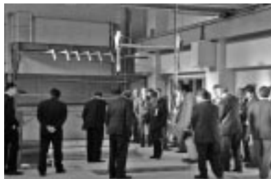
施設内を見学する出席者