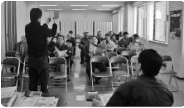
後期高齢者医療制度の説明会(会場:役場)

北海道では、平成十九年三月一日に道内全百八十市町村が加入する特別地方公共団体として「北海道後期高齢者医療広域連合」が設立されている。 各市町村が保険料の徴収や届出の受付、被保険者証の引渡など一番身近な窓口業務を行うことになる。