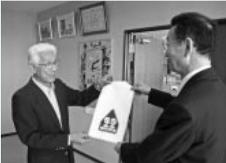
藤観光バス松森社長