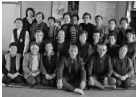
九重地区の皆さん