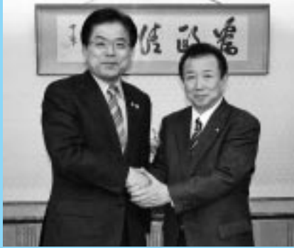
増田大臣と握手をする森町長

これは、平成十九年度の各町厚生病院損失金に對する財政支援要望（特別交付税措置）に對して、増田寛也総務相が「公的病院も交付税の対象とする」旨の発言に對するお礼や平成二十年度の制度化についても病院と診療所も同等の扱いにしてほしい旨を、各町長が團結して要望行動を行ったものである。