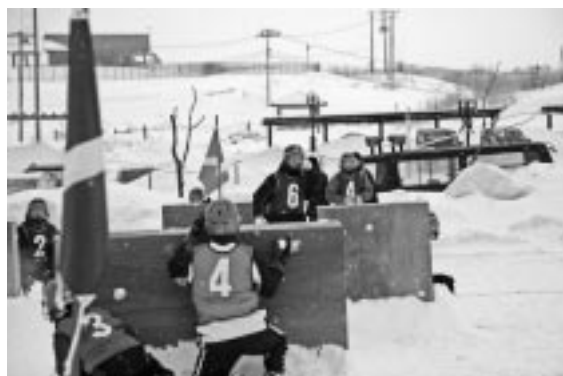
雪玉の攻防が繰り広げられた

第1試合から熱戦が繰り広げられ、羽幌ガンバルマンズが昭和新山大会出場の実験を生かし優勝した。古丹別中学校野球部は、連覇を目指し健闘したが準優勝。応援団を含め約100人は、北国ならではの冬の日を楽しんでいた。