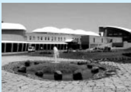
「道の駅」風Wとままえ

などのテイクアウトメニュー 特産品などのお土産 接客・サービス 清潔感の9項目を5段階評価して、百点満点に換算し、その平均点を「全体の満足度」としているもの。