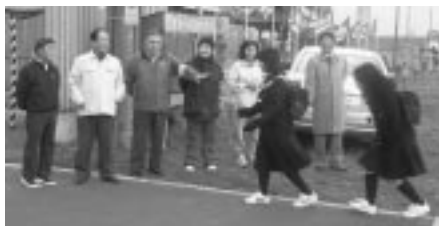
苫前中学校で声かけを行う民生委員

初日となった10月22日(水)は、登校時間に合わせて7時45分から苫前中学校と古丹別中学校校門前で、「おはよう、交通に気をつけて」と声かけを行った。