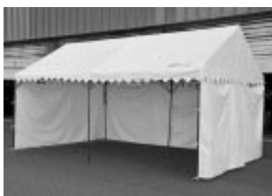
助成事業で購入したテント

宝くじの収益金は、販売総額のうち賞金と経費などを除いた約四十%が、発売元である地方自治体へ販売実績に応じて収められ、公共のために使われています。