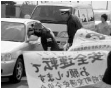
昔前で安全運転を呼びかける

最終日となる三十日(火)は、昔前中学校前の国道で街頭啓発が行われ、交通安全協会、交通指導員、町内の婦人団体や現場職員など約五十人が交通安全旗を掲げ、安全意識の向上を促すほか、ドライバーには啓発資料やパンフレットを手渡し、シートベルトの着用や安全運転の呼びかけを行った。