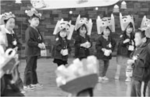
豆を握って鬼の登場を待つ子どもたち(古丹別保育所)

古丹別保育所では、子供たちが自分に潜む「夜寝ない鬼」「わがまま鬼」「歯磨きしない鬼」などを追い払ったあと、所長が扮する赤鬼が登場。「鬼は外」と元気に豆を投げつける子や逃げ出す子、泣き出す子など様々であったが、最後は鬼を退散させた。 また、苫前保育園では、消防署員が扮する赤鬼と青鬼が雷太鼓の音と共に登場、「火遊びする子はいないか」と子供たちを追いかけた。鬼の迫力に泣き出す子もいたが、元氣よく「鬼は外、福は内」の豆まきに、最後は鬼も降参した。