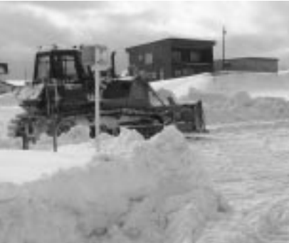
駐車場の除雪を行う重機

また、東北建設(株)は、従業員二人が出動し、スリップ防止や歩行者の転倒防止のため、ふわつと前町道の砂まきを行った。 大会実行委員会では「毎年、大変助かっています」と感謝していた。