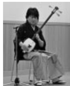
津軽三味線ショー