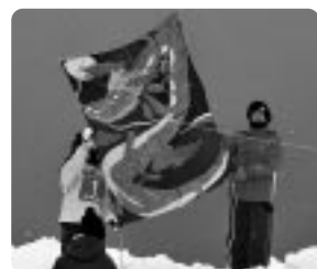
苫前中学校の大凧

だが、連凧の部に出場した。色鮮やかな連凧は、上空高くまで続いていた。 午前十一時からは第二部の中学生の部、高校・一般の部、大凧の部が開始された。 大凧の部では、ここ数年苦戦を強いられていた苫前町商工会が、順調に上げたものの、糸が切れるトラブルに見舞われていた。また、今年こそは最優秀賞を狙う苫前地域マリンビジョン協議会は、デザインにも気合いが入った。総勢二十人以上の引き手が一齐にロープを握り走るも、金太郎の大凧は上がらず三度の失敗。しかし、四度目の挑戦で空高く舞い上がると、見物客から大きな歓声が上がった。 ふわつと前会場では、地元特産品の売店コーナーが多数出店