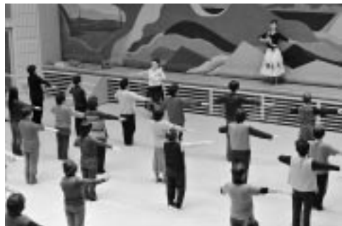
講師の指導で基本動作を練習する参加者たち

実演では、フラダンスの基本である姿勢やステップ、手の動きを中心に指導が行われ、参加者たちは一時間ほどで一曲が踊れるほどに上達していた。