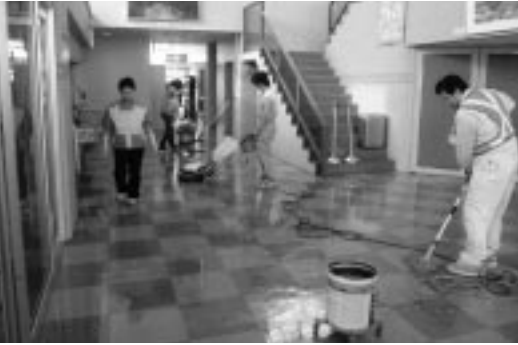
公民館ロビーの清掃を行う北都建設工業株の職員

町では平成十九年度から清掃の委託業務を廃止しており、ワックスがけは二年ぶりとなる。本職ならではの技術で、ホールは見ちがえるほど明るくなった。 訪れた町民も「ピカピカできれいだね」と喜んでくれた。