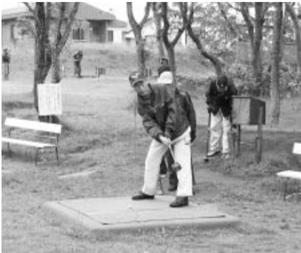
一打・一打に集中する参加選手