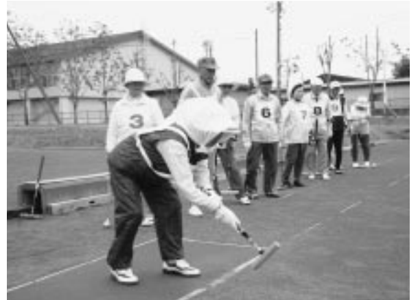
強風を味方につけながら熱戦が繰り広げられたゲートボール大会