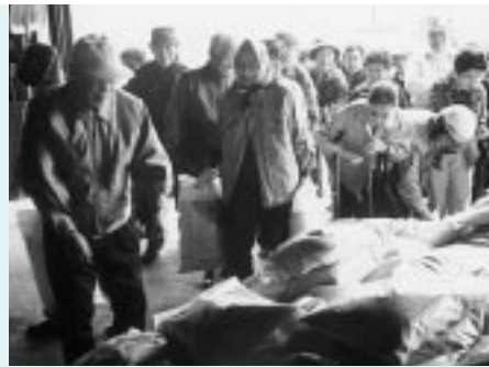
きらりコンポストを受け取る人々

この堆肥は、生ゴミの排出量に応じて中部3町村に配分されたもので、今後も生ゴミの堆肥化に応じて年1~2回程度は無料配布される予定。また、この堆肥は生ゴミから作られているため、若干塩分濃度が高く、多量に使用するには注意が必要とのこと。