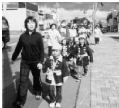
街頭パレードを行う苦前保育園幼年消防クラブ

頭パレードが行われ、啓蒙物品を配布するなど、「火事を出さない出させない。」と呼びかけていた。運動期間中は、各家庭での住宅防火診断も行われていた。