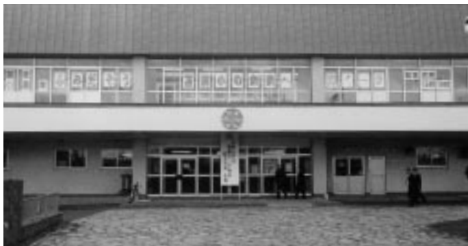
120周年を迎える苫前小学校校舎