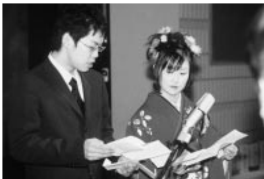
昨年の成人式から

11月27日(木) 28日(金) 計2回 午後7時から午後8時30分まで 苫前小学校(コンピューター室)