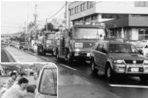
上 古丹別地区消防車両パレード 左 農協婦人防火クラブ街頭PR

北留萌消防組合苦前支署(川森光治支署長)と同古丹別支署(伊藤優樹支署長)では、秋の火災予防運動期間中(十月十五日から三十一日)に「その油断 火から炎へ 災いへ」をスローガンに町民の生命と財産が失われないようにと火災予防運動を実施した。 運動は期間初日の十五日に、苦前・古丹別両地区において、消防及び危険物安全協会車両約二十台が車両パレードを行い、苦前町農協婦人防火クラブや幼年消防クラブ(苦前保育園児)の会員が消防職員とともに、十五日古丹別地区で街頭PR、十七日苦前地区で街