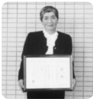
受賞を喜ぶ大川会長

同会は、昭和五十八年から始まった食生活改善推進員養成講座により各地区に推進員が養成され、昭和六十三年に「食生活改善を進める者の相互連絡と理