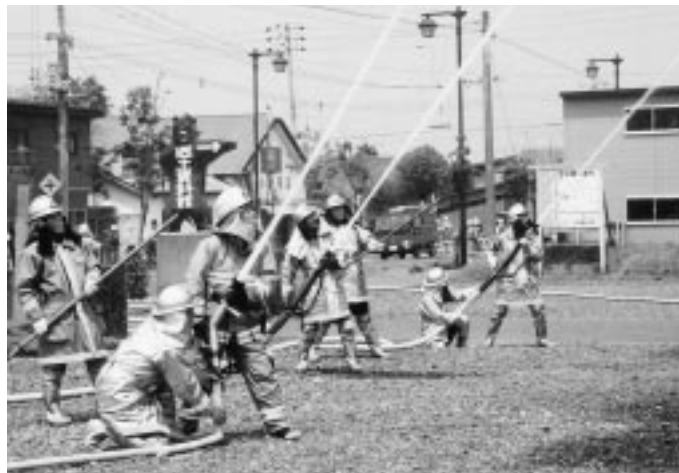
実践さながらの模擬火災訓練の様子。場所は郷土資料館