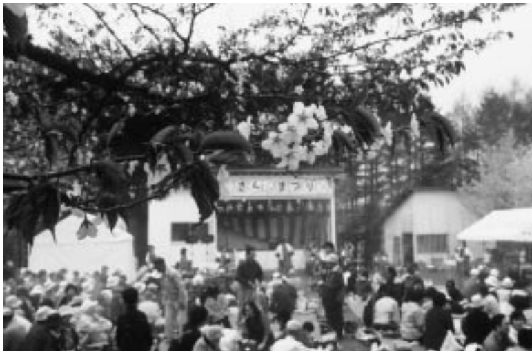
満開の桜の下で、行楽客が席を埋めつくし、催しに拍手が絶えなかった

まつりでの催しでは、プロ歌手による歌謡ショー、子ども舞踊、苔前鱗萃会によるYOSAKOIソーラン踊り、AKOISOーラン踊り、カラオケ、特設無線局のほか、そばやおでん、タコ焼きなどが出店を連ねまつりムードを一層盛り上げた。 今年も鱗萃会によるYOSAKOIソーランの演舞が華を添え、会場からは大きな拍手が沸き上がっていた。 また、公園下の花井商店横の広場では町花木会による緑花木や盆栽、苗木などを即売してにぎわいを見せていた。