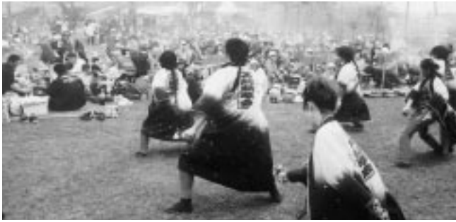
今年も苔前鱗萃会のよさこいでにぎわった

樹齢四十年級のソメイヨシノやエゾヤマザクラなどが約五百本立ち並ぶ「道北随一の桜の名勝」の緑ヶ丘公園で、五月十一日に「さくら祭り」が行われた。今年で三十二回目を迎える同祭りは、十一時開演の花火の合図が鳴り響くころには家族連れや職場の仲間、グループなどが席を埋めつくし、約二千人の行楽客でにぎわった。 好天のもとさつそく炭に火を入れ、ジンギスカンやホルモン、とり串などを囲んでビールやジュースとともに満開のさくらを満喫した。