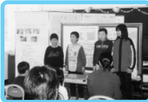
発表を行う子どもたち

力昼小学校四、六年生四名が、これまでの力昼を流れる川の水质や水生昆虫の実態調査などをもとに、「下流に行くほど川のごりがあり、生活廃水の中で節水や残り油のふき取り、使用洗剤の少量化などを実践し、川水をきれいにしよう。」と報告。参加していた地域住民からは「解り易く、大変参考となった。川は地域の宝であり、もっと大切に使わないといけない。町内会でも是非PRしていきたい。」と感想を述べられていた。