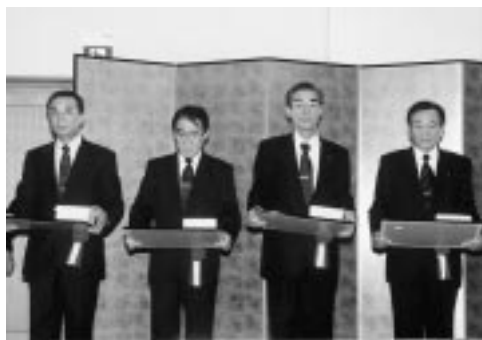
表彰状を授与された自治功労者