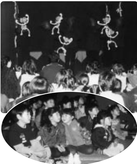
人形劇を楽しむ子どもたち

また、二日には陶芸やパッチワークの体験コーナーが設けられ、多くの来館者が訪れていた。また、二日は抹茶サービスも行われ、大正琴の演奏もあつた。公民館で楽しむ内容が多くなって、多くの来館者が訪れていた。