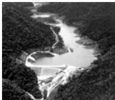
本年6月に撮影された上小川ダム

六十七万立方メートルと管内最大の規模を誇る。下流に約三百七十ヘクタールの農業地帯を洪水期・融雪期の水害から守り、五十年に一度の大雨にも耐えることができ、併せて農業用水の安定確保が図られる。