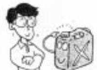
ふたは確実に閉める