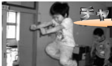
古丹別保育所での連続運動サーキット