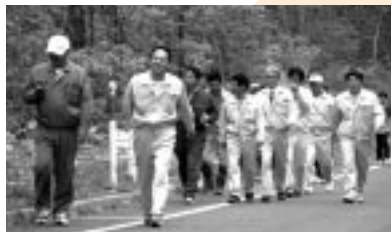
橋場産業(株)職場でのウォーキング