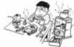
使用中は火気厳禁