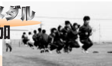
苦前中学校学年別対抗縄跳び大会