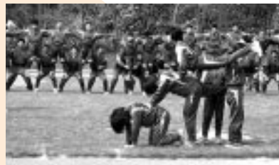
古丹別中学校でのタンブリング練習