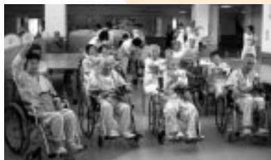
厚生病院でのリハビリ体操