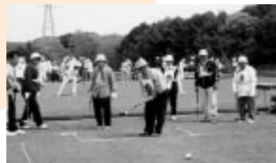
留萌中部3町村ゲートボール大会