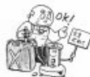
火を止めてから給油する