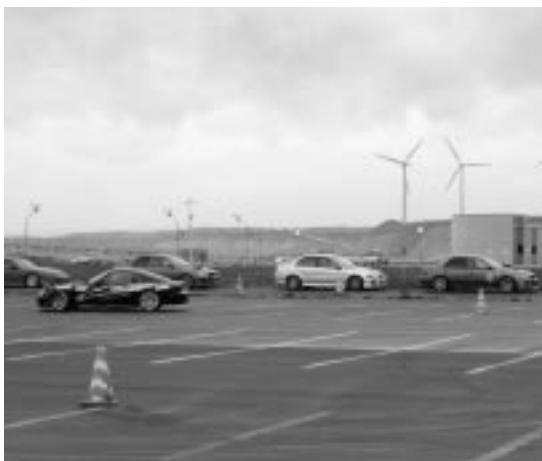
安全な運転テクニックを学んだ

当日は、低気圧接近で天候が悪く、ミニバイクのストラローム試乗などは中止されたが、千葉部長らは事業終了後には早くも、第3回に向けての企画に夢をふくらませていた。