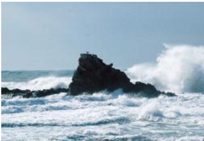
ローソク岩も冬支度