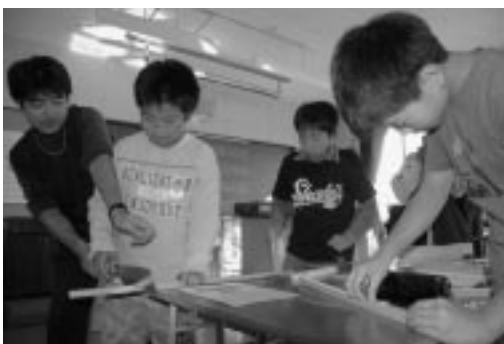
のこぎりの使い方を学ぶ児童

児童らは、ノコギリの握り方から教えてもらい、真剣に小鳥のえさ台づくりに取り組んでいた。