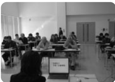
研修を受ける札幌山の手地区民生委員