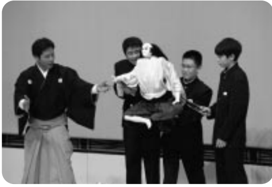
文楽人形の使い方を体験する生徒

最初に、恋がきつつかで江戸時代に実際に起こった事件に基づいて書かれた物語「伊達娘恋緋鹿子」を鑑賞した。次に、実際に生徒が舞台上がり、三味線