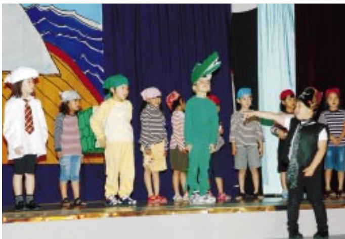
古小1年生：ピーターパンのいる島