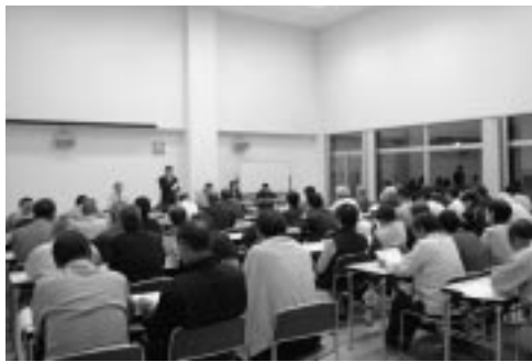
約70人が出席した会議の様子

下水道に関する問い合わせは、建設課にて、いつでも、どこへでも説明に伺いますので、まずご連絡下さい。 電話直通：64-2315 メール：gesui@town.tomamae.lg.jp