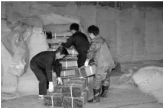
次々に倉入れされる特産コンブ

当町のコンブは、利尻コンブとして高値で(17年は15 + 詰め4万4千円ほど)北海道ぎよれん留萌支店をとおして、大阪方面に出荷されている。