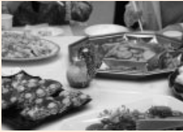
地場産品を使用した8品目の料理