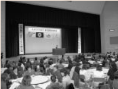
約200名の女性団体会員らが参加