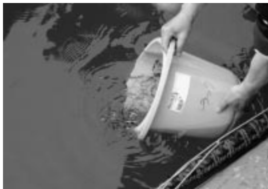
中間育成されているニシン稚魚

この日は、留萌北部地区水産技術普及指導所職員や北るもい漁業協同組合苦前支所職員、町内漁業関係者らがトラックからホースを使い岸壁に用意された「いけす」に稚魚を移した。「いけす」は、五層四方で深さ二・五 メートル 、岸壁より五百 センチ ほど離れた北防波堤の中ほどに運ばれ、日に三度のエサが与えられ、約三週間の中間育成後に大海に放たれる。