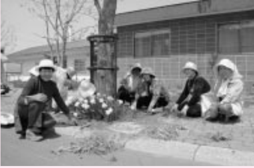
雑草除去に精を出す苫前婦人会の皆さん