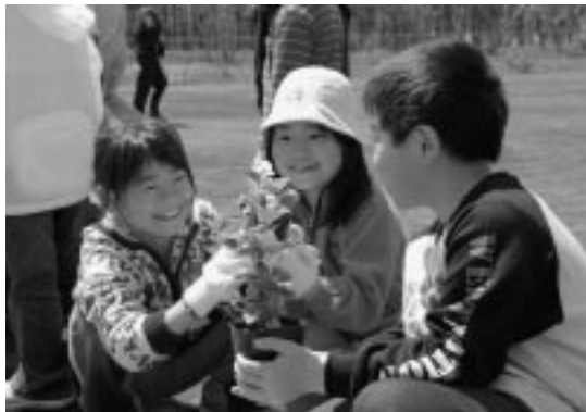
子どもの笑顔には思いやりがいっぱい(苫小)