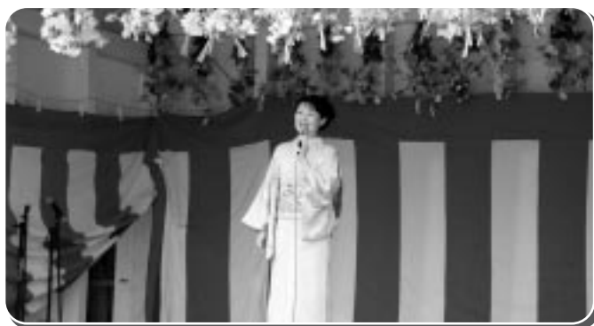
千原早啼歌謡ショー

また、出店コーナーでは、商工会女性部や古丹別婦人会などの、そばやミニラーメン、たこやき、味噌おでん、特産コーナーでは、ゆうゆうのぬいぐるみや陶芸などが販売された。十三日(土)～十四日(日)の二日間は、盆栽や苗木の即売会が花井商店横の広場で開催され、大賑わいであった。