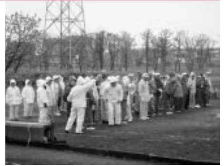
雨の中3町村のゲートボール大会も行われた