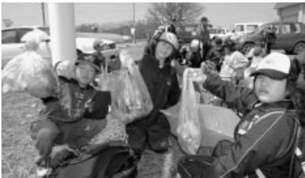
旭雪センターまでに拾ったゴミ類

冬期間は雪の中に埋もれていてよくわからなかったが、雪がとけると、ポイ捨ての空き缶も目立つようになった。自分たちが住んでいるまちを 子どもから大人まで協力しながら、ゴミ拾いをする事により、「心まであらわれたよな気がする。」と言った参加者の感想もあった。 回収したゴミは、翌日、羽幌にあるゴミ処理場に搬入された。（一般ゴミ二〇kg、破碎ゴミ二五五kg、粗大ゴミ三五kg）三八九人もの町民の皆さまが力を合わせてきれいにした、まちを、町民の皆さんで大切にしましょう。