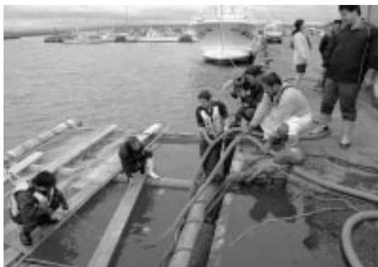
運ばれたニシンの稚魚がホースでいけすに移される