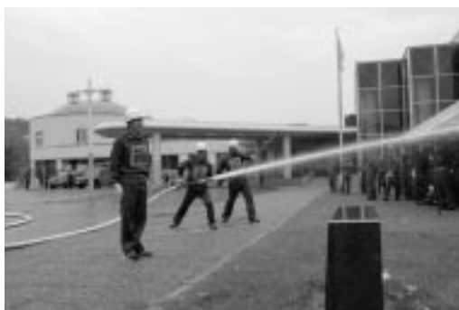
苫前分団によるポンプ操法

号令とともに歯切れの良い団 員の動きは、会場内に緊張を走 らせた。その後、分列行進、模 擬火災訓練が雨のなか、古丹別 保育所が火元に想定されて行わ れた。 住民の尊い生命や貴重な財産 を火災から守るため、消防団員 はもちろんのこと、町民の皆様 も協力して、火災・災害のない まちづくりに努めましょう。