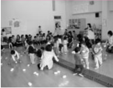
苫前保育園の園児の皆さん