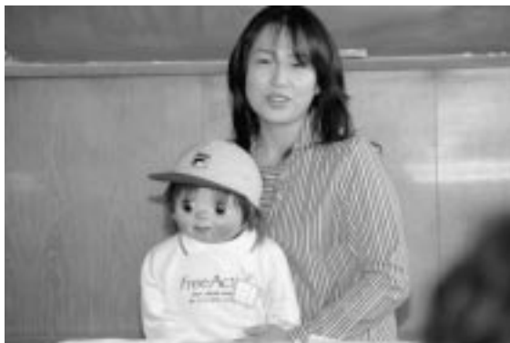
ユーモアたくさんのケンちゃん

最後に、町企画振興課商工観 光係の後藤主任主事より、悪質 商法防止のための講話を行った。 参加者は、約3時間におよぶプ ログラムであったが、「充実した 時間を過ごすことができた」と 満足な様子で学習会を終えた。