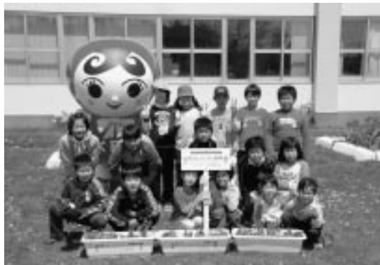
後列左端が「人KENあゆみちゃん」(キャラクター)