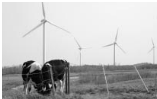
癒しの世界の中で仲良く牧草を食べている

また、24日（水）には、一頭ずつ体重測定等が行われ、本格的な放牧が始まった。200ヘクタールの広大な草原に放された、牛たちは、39基の風車と絶景な日本海を眺めながら、10月中旬まで放牧され、100キロ以上体重を増やして、それぞれの牛舎へ里帰りする。