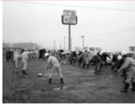
三協建設の皆さんがラジオ体操（字興津）