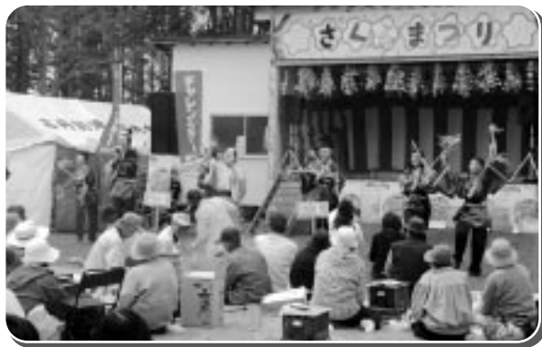
マツケンサンバを踊る苫前鱗萃会のメンバー

また、出店コーナーでは、商工会女性部や古丹別婦人会などの、そばやミニラーメン、たこやき、味噌おでん、特産コーナーでは、ゆうゆうのぬいぐるみや陶芸などが販売された。十三日(土)～十四日(日)の二日間は、盆栽や苗木の即売会が花井商店横の広場で開催され、大賑わいであった。