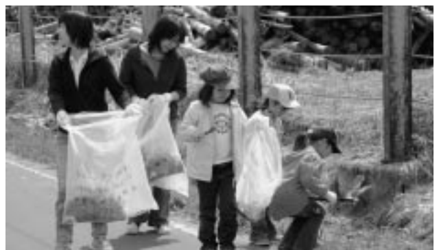
古丹別市街地のゴミ拾いをする親子

「遠足について、子どもたちと話し合いをした結果、ゴミ拾いをしながら目的地のホワイトビーチまで歩くことにした。」（松浦教諭）横四〇cm×縦七〇cmほどの大きなゴミ袋に空き缶などが五袋分もあった。空き缶などのポイ捨てがなかなか減少しない中で、「遠足」と「ゴミ拾い」を融合させた遠足をを行った、子どもたちと担当教諭に拍手をおくりたい。