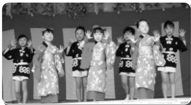
子ども舞踊のメンバー