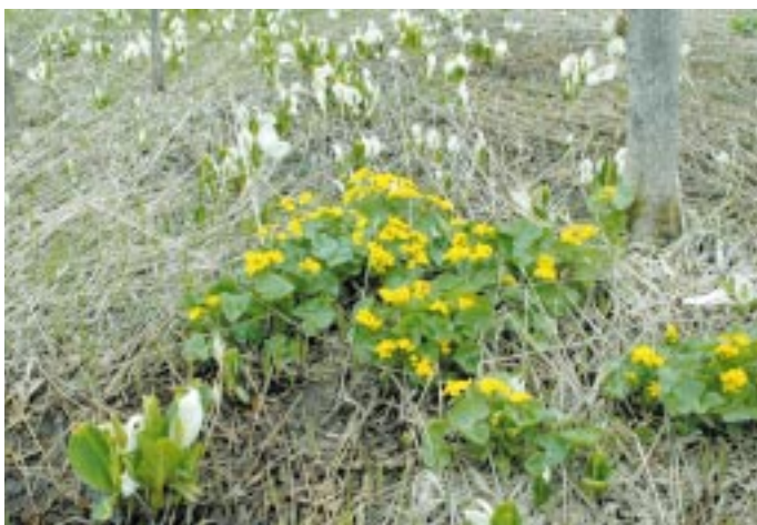
ミズバショウとヤチブキ