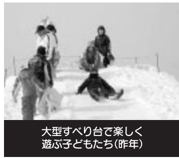
大型すべり台で楽しく遊ぶ子どもたち(昨年)

聞 「手をつないだらここが一番! 見えてきた」 更新中です。 http://fine.ap.teacup.com/moeinoron/ ■萌える天北オロロンルートブログ ルート情報満載のブログは随時更新中です。 萌える天北オロロンルート 運営代表者会議事務局 電話 0164442238871 FAX 0164442238856 Eメール tenpoku-ororon@moeru.fm