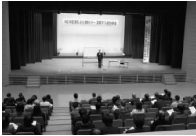
約120人が参加した研修会