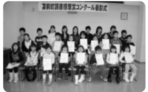
入選者全員で記念写真