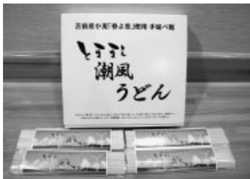
「とままえ潮風うどん」 十袋入り二千五百円

一袋150グラム入り250円、ギフト用10袋入り2,500円で、Aコープオリーブ、Aコープとままえの両店舗、道の駅風Wとままえで販売している。また、生産者ら関係者で試食会を依頼した「まさ亭」（古丹別）では、すでにメニュー化されており、お客さんの評判も上々とのことである。