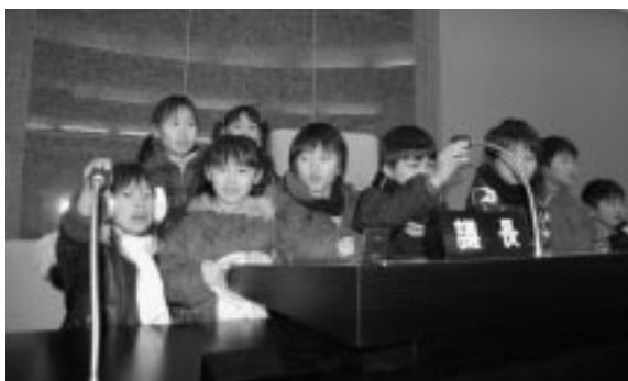
議長席に集まり、興味津々にマイクに触れる

これは、学社融合事業の一環で、二年生の生活科「もつとマチのことを知りたいね」をテーマにし、マチの歴史やマチの仕事について学習を深めた。 当日は、総務財政課加賀谷係長が各課を案内しながら、仕事の内容を説明した。また、議場では、議長席などに着き、実際にマイクを使うなど、興味津々にマチの仕事について学習していた。