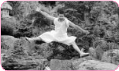
大桃園の池にダイブ!!!