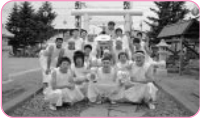
古丹別神社前にて