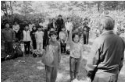
「森の学校 遊々の森」宣言をする赤坂くんと岸さん