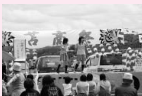
特設ステージのカラオケの様子