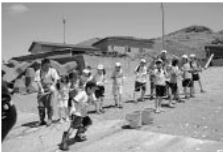
青空の下で地引網体験をする苦小4年生

網の中には、ウグイやアイナメ、ウミタナゴなどがかり、児童らは歓声をあげていた。工藤所長は「このような体験をとおして、海や魚に関心を持ってほしい」と話していた。