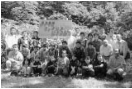
設置した看板の前で記念写真

今後、町公民館では、親子や成人向けの森林教室も計画し「森の楽校 遊々の森」を有効活用する予定である。