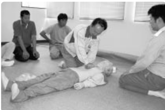
心肺蘇生法を学ぶ

古丹別支署の草薙救急係長が講師を務め、午後一時から午後四時まで、「もしもの場合」に備え、基本的な心肺蘇生法やAEDの使用法、異物除去法、止血法などを学んでいた。