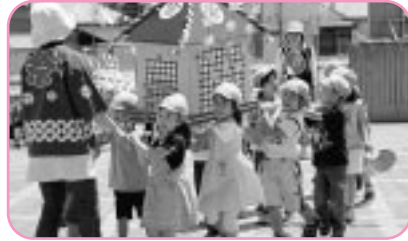
保育園お祭りごっこ