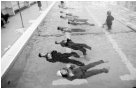
苦中2年生の着衣泳教室

教室では、海や川などに転落したことを想定し、買い物袋やペットボトルなどを使って浮く方法（ラッコ浮き）などを学んでいた。