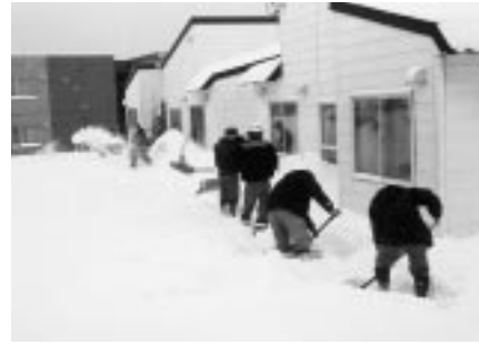
除雪奉仕するオリエンタル建設（株）並びに東北建設（株）の作業員たち

町内で公共工事請け負っているオリエンタル建設株式会社が協力会社である東北建設株式会社とともに、独居等高齢者世帯の除雪奉仕作業を実施した。 作業には、同社の作業員十名が参加し、屋根の高さまで積もった雪をスコップやスノーダンプでかき出し住宅は明るい日差しを取り戻し、お年寄りから喜ばれていた。 一方、同月十五日には、古丹別消防団員による高齢者世帯（六件）の安全確保を目的に除雪奉仕作業も行われ、冬場の火災予防を呼びかけていた。