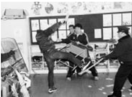
不審者を取り押さえる先生や羽幌署員

この訓練は、冬休み期間中に教員間で訓練マニュアルを作成し、安全に早く避難できる能力と態度及び誘導を身につけることを目的に実施され、管内では初の試み。不審者侵入の対応に先生の表情は緊張感が漂い、警察が駆けつけ、不審者を取り押さえる姿は、本番さながらの迫力ある訓練でした。