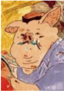
『千と千尋の神隠し』