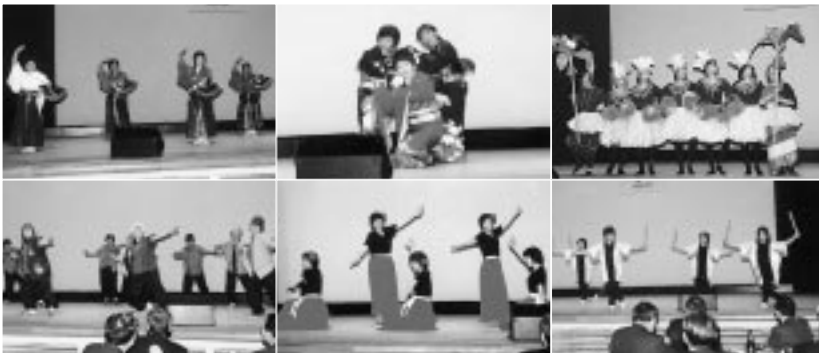
各地区からの舞踊やダンス、ヨサコイなどが披露されたアトラクション

また、祝賀会では各地区のグループによるアトラクションが披露され、きれいな衣装に身を包み、若返る会員たちの嗜好こらした踊りや歌を楽しんでいた。