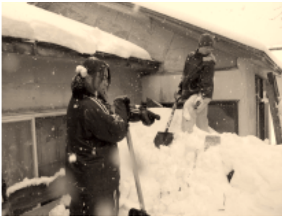
屋根の雪下ろしをする苦商高生たち