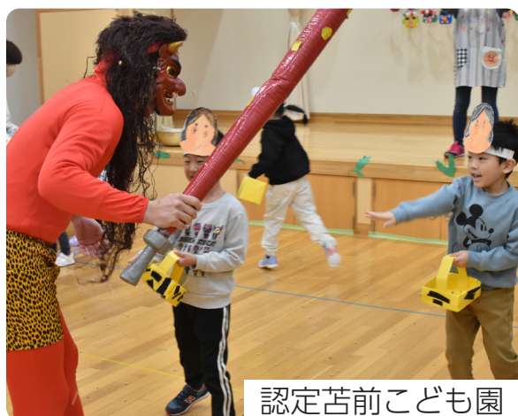
認定苦前こども園