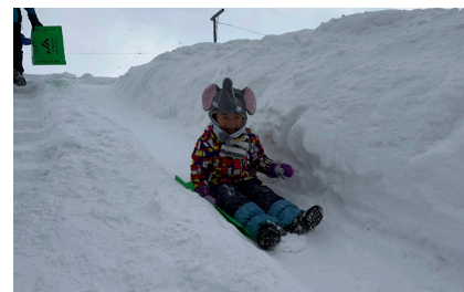
カンガルースクール 「雪あそび」