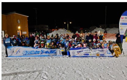
冬遊び～エンジョイナイト in 三角点～