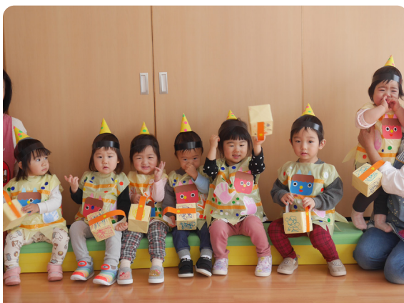
認定古丹別こども園