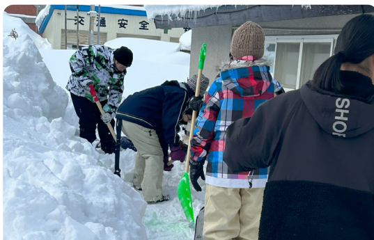
苫前商業高校生による除雪ボランティア

2月4日、苫前消防団・古丹別消防団の定期訓練に併せて、苫前地区・力屋地区・古丹別地区の高齢者宅を対象に避難経路確保を目的とした除雪ボランティアが行われました。実際に1人では避難が困難な方も多く、災害へ備えることができました。