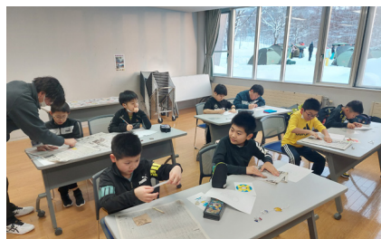
冬の宿泊体験事業 in ネイパル深川