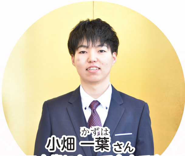
かずは 一葉さん 三十歳になって今まで支えてくれた親にたくさん親孝行します。