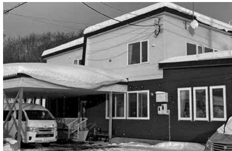
昨年4月に開設された 介護付き有料老人ホーム

入所状況については順調に進んでおり、事業者側からは年内に定員の27名が入所予定である旨の説明があった。新型コロナウイルス感染症拡大もあり、予定に遅れが生じているようだが、冬を迎え季節的な入所相談もあると聞いている。町民からは施設が近くにできて喜んでいっていると聞いている。施設運営上の相談は今のところ特に無いが、今後の