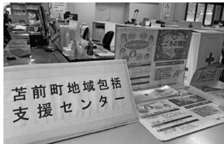
役場内に設置されている 地域包括支援センター

介護を考え始めた時に具体的な対応が分からない場合の相談窓口については、保健福祉課が所管している地域包括支援センターで9人体制により常時対応している。指摘を踏まえ、これまで以上に町民に対して周知を行い、親切できめ細かな介護ケアに今後とも全力を尽くしたい。