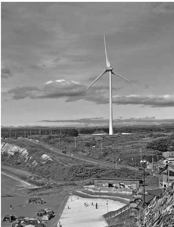
町営風車 風来望 4号機