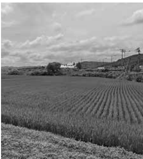
古丹別に広がる水田

見直し案の発表後、影響額等を算定したところ、産地交付金のみならず水田を畑地化した場合の中山間地域直接支払交付金や多面的機能支払交付金にも影響する可能性を考慮し、最大3億円の農業所得減少となる試算結果となった。この見直しは農業所得の減少に直結するだけではなく、条件不利地での営農を余儀なくされ、労働時間の増加や品質の悪化によるブランド力の低下など、地域に及ぼす影響は甚大であるが、秋には交付対象ルールの具体化が示される予定である。水田活用に関わる対策が決まらなければ第6期農業振興計画も策定できない状況である。中山間地域における対策を求め、道農政部長等へ意見をしてきたが、今後も農業者が不利益とならないよう国・道の対応策に注視し、行政として強く訴えていきたい。