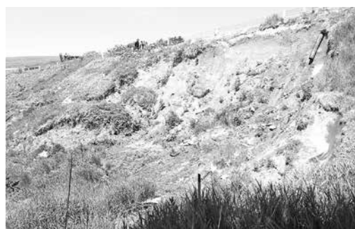
融雪災害を受けた昭和羽幌界線