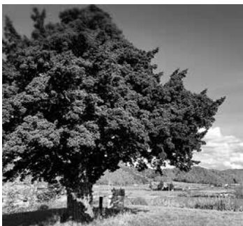
苫前町の宝「一本松」

両氏の墓石は、追悼の意を表するためにも、行政としてどのように対応することが最善か、前向きに検討する。