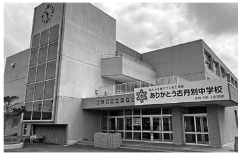
今年度で廃校になる古丹別中学校

令和5年度の中学校統合に向け、令和4年度をもって廃止となる古丹別中学校の所要整備を行う。