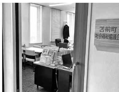
コミセン内にかまえている社会福祉協議会